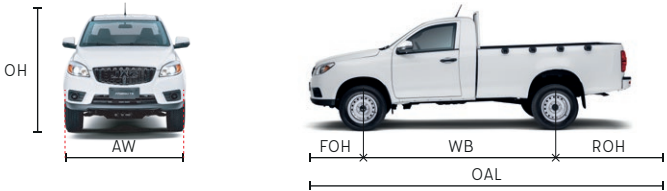
Dimensiones recomendadas de caja (mm)