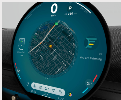
Unidad interactiva MINI. Pantalla central OLED con un área de 440 cm 2 .