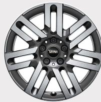
Rin 17" Parallel Spoke || 2-tone Spectre Grey Dark metallic.