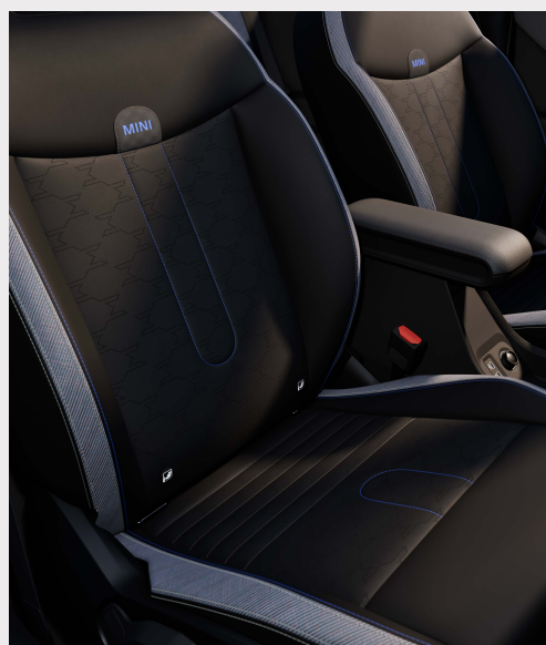
C / S: Asientos de piel sintética en combinación con tela.