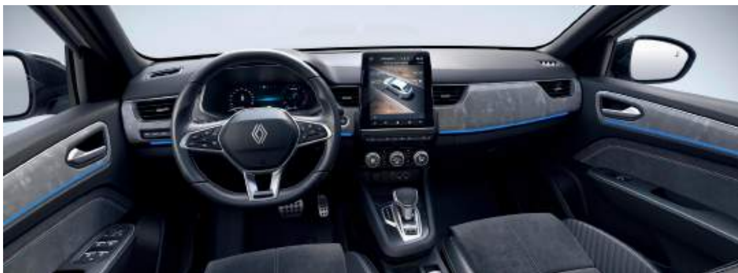
esprit Alpine (techno +)