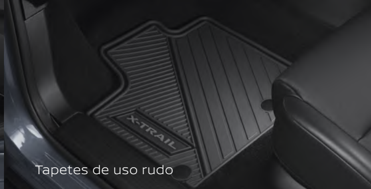
Tapetes de uso rudo