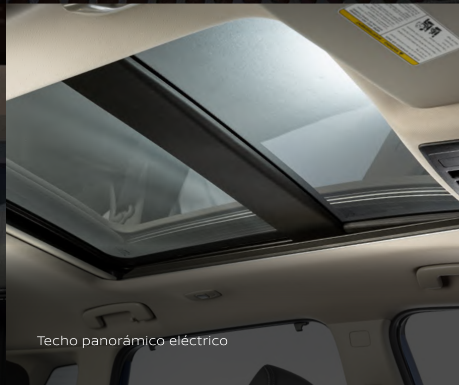
Techo panorámico eléctrico