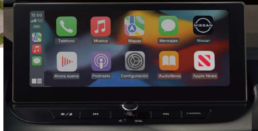
Pantalla digital 12.3"