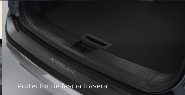
Protector de fascia trasera