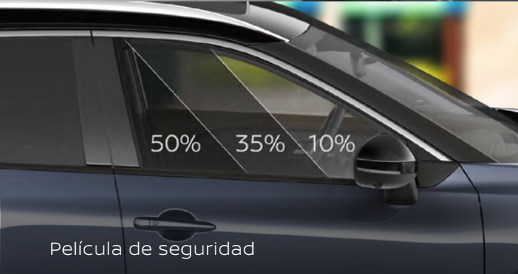
Película de seguridad