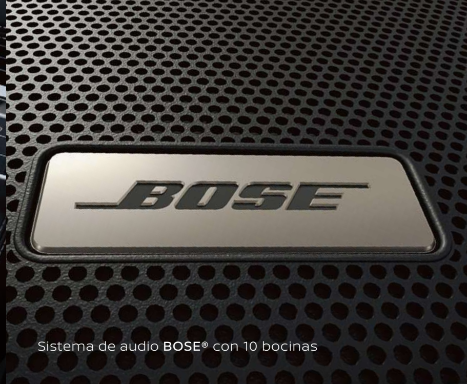
Sistema de audio BOSE® con 10 bocinas