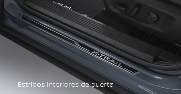
Estribos interiores de puerta