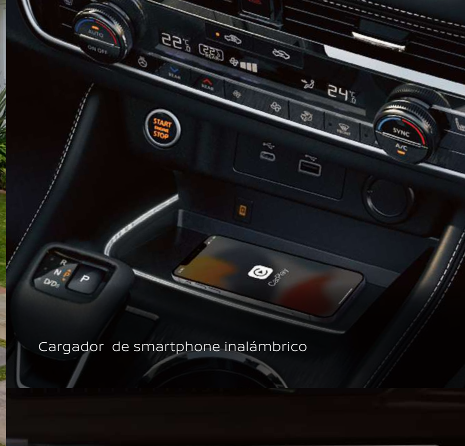
Cargador de smartphone inalámbrico

Imágenes de referencia. Los accesorios mostrados pueden venderse por separado. Consulta la ficha técnica para conocer el detalle de especificaciones. Consulta nivel de equipamiento y disponibilidad por versión y zona geográfica con tu Distribuidor Autorizado Nissan o visítanos en Nissan.com.mx