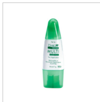
Multipurpose Liquid Glue