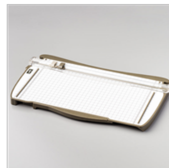
Stampin' Trimmer (Metric)