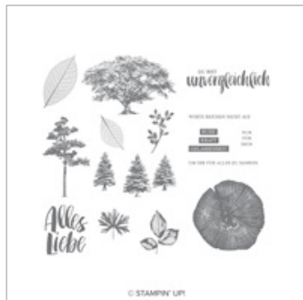
Kraft Der Natur Clear-Mount Stamp Set (German)