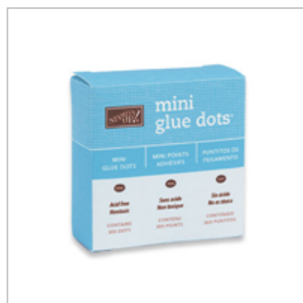
Mini Glue Dots