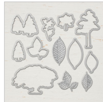
Nature's Roots Framelits Dies