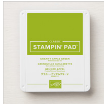
Granny Apple Green Stampin' Pad