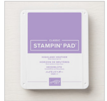
Highland Heather Classic Stampin' Pad