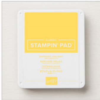
Daffodil Delight Classic Stampin' Pad