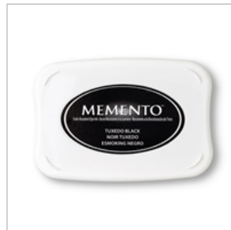
Tuxedo Black Memento Ink Pad