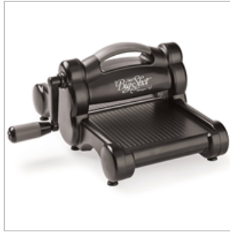
Big Shot 143263