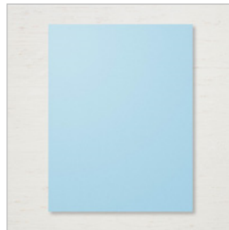
Balmy Blue 8-1/2" X 11" Cardstock