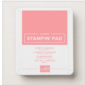
Flirty Flamingo Classic Stampin' Pad