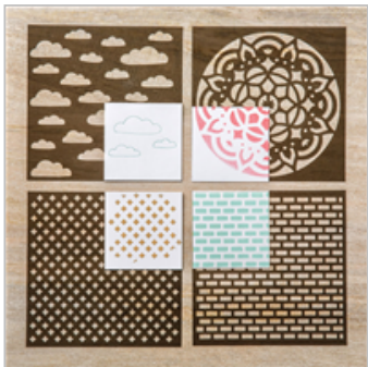
Pattern Party Decorative Masks 144103