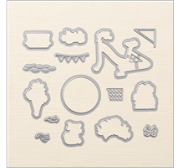
Build A Bike Framelits Dies 143729