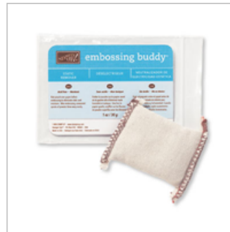
Embossing Buddy 103083