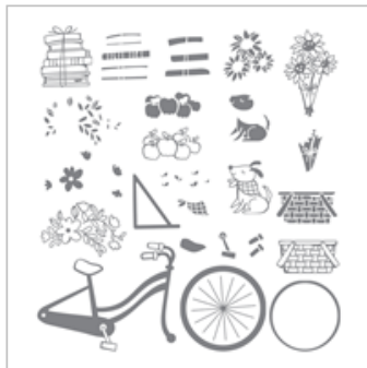
Bike Ride Photopolymer Stamp Set 143716