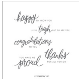
Friendly Expressions Clear-Mount Stamp Set 146673