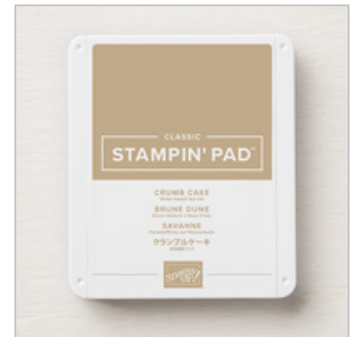
Crumb Cake Classic Stampin' Pad 147116