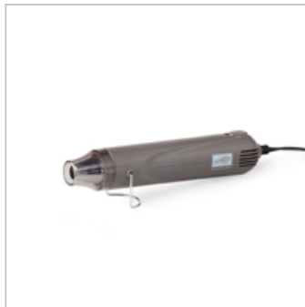
Heat Tool (Us And Canada) 129053