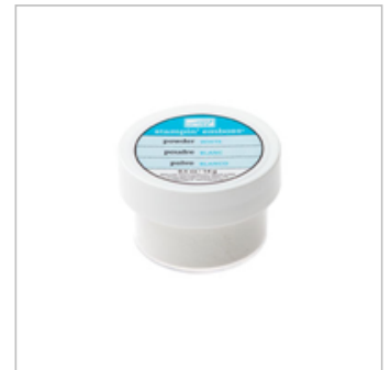
White Stampin' Emboss Powder 109132