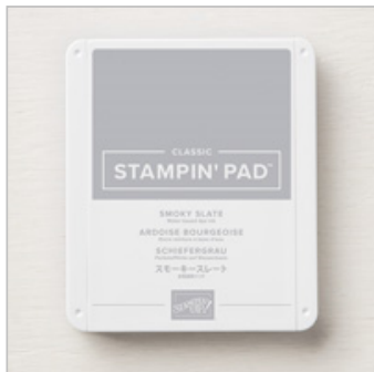
Smoky Slate Classic Stampin' Pad