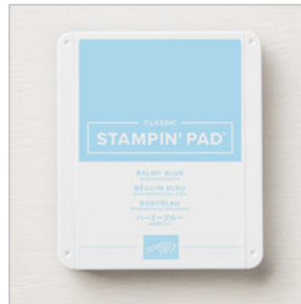
Balmy Blue Classic Stampin' Pad 147105