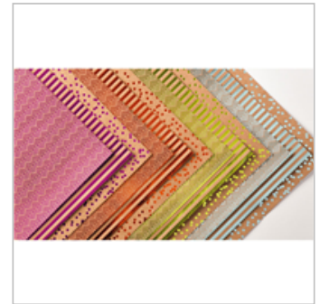
Foil Frenzy Specialty Designer Series Paper