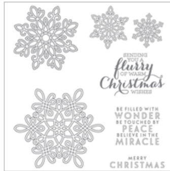
Flurry Of Wishes Photopolymer Stamp Set