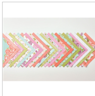
Petal Garden Designer Series Paper Stack