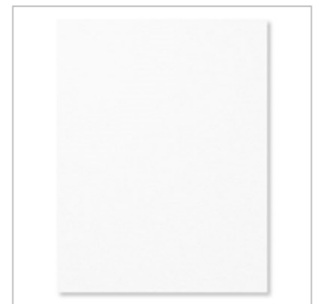
Whisper White 8-1/2" X 11" Cardstock