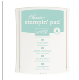
Pool Party Classic Stampin' Pad