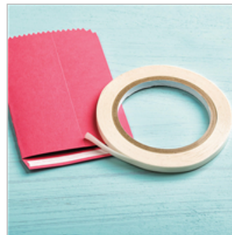
Tear & Tape Adhesive