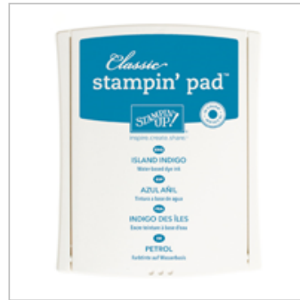
Island Indigo Classic Stampin' Pad