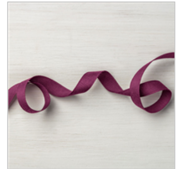
Fresh Fig 1/2" Finely Woven Ribbon