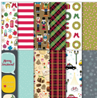
Christmas Around The World Designer Series Paper