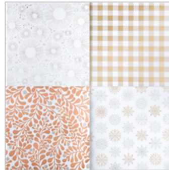
Year Of Cheer Specialty Designer Series Paper