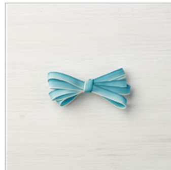
Island Indigo 1/4" Ombre Ribbon