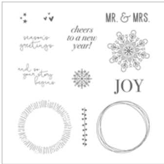
Cheers To The Year Clear-Mount Stamp Set