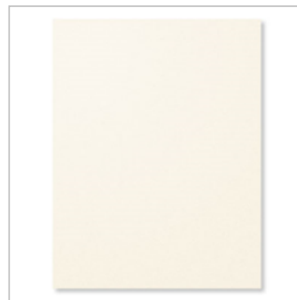
Very Vanilla 8-1/2" X 11" Cardstock