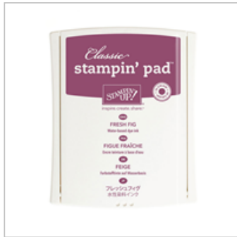
Fresh Fig Classic Stampin' Pad