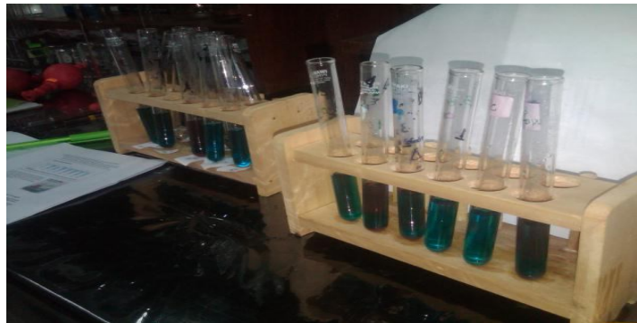
Tabel 2. Hasil pengenceran stok glukosa