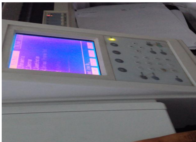
Gambar 2. Spektrofotometri

Didapatkan panjang gelombang maksimal larutan standar urea 40ml menggunakan spektrofotometri yaitu \lambda = 689,5 \text{ nm}