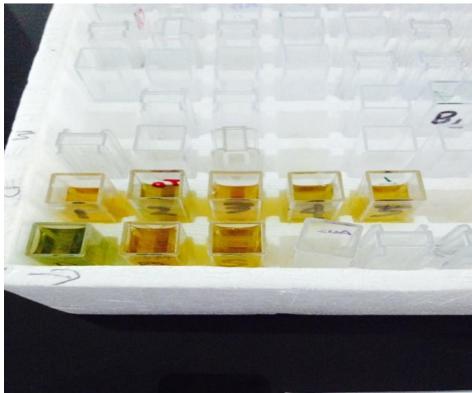
Gambar 1. larutan urea pada kuvet yang berisi larutan standar, larutan sampel dan blanko