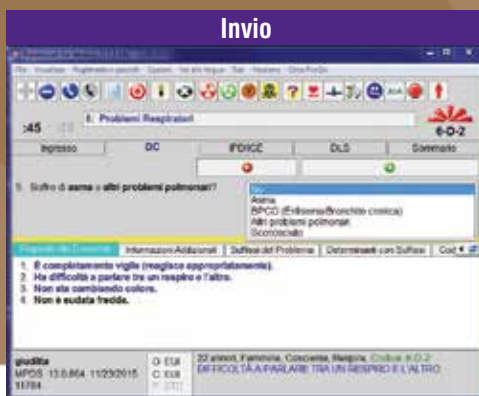
La logica esperta raccomanda automaticamente i codici d'invio appropriati.

ProQA® Paramount permette all'operatore di controllare tutti gli aspetti di una chiamata. La facile navigazione si traduce in pieno accesso di tutte le funzioni dei Protocolli IAED. Inoltre, i numerosi strumenti di ProQA Paramount accelerano la raccolta di informazioni aiutando a ridurre i tempi per l'invio dei soccorsi. ProQA Paramount include un modulo separato per l'operatore che dà agli altri operatori, calltaker e supervisor accesso immediato alle informazioni pertinenti al caso in evoluzione.